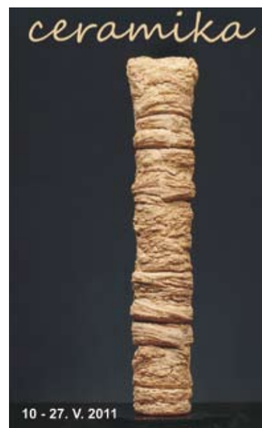
10 - 27. V. 2011

Autor wystawy to absolwent Uniwersytetu Sztuk Wizualnych w Pradze. Obecnie nauczyciel wzornictwa i rzeźby na Uniwersytecie w Ostrawie. Swoje prace prezentował na wielu wystawach indywidualnych (m. in. Ostrawa, Praga, Brno, Opawa) i zbiorowych (Polska, Niemcy, Szwajcaria, Słowacja, Francja, Japonia, Belgia, Austria). W swej twórczości jest perfekcjonistą, operuje czystą, geometryczną formą łącząc ją ze swego rodzaju tajemniczością przez zastosowanie otworów, szczelin, pęknięć, rys... Wszystko daje poczucie doskonałości, harmonii, a zarazem kruchości.