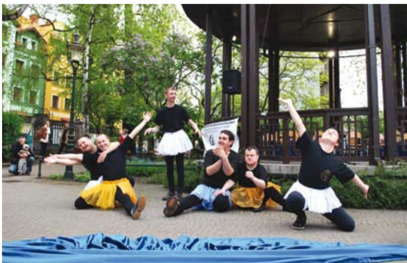
Występy podczas ubiegłorocznych Obchodów Dnia Godności, fot. K. Biedal